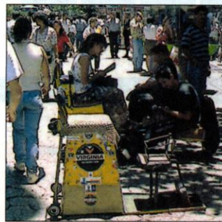
Trabajo independiente. Lustrabotas