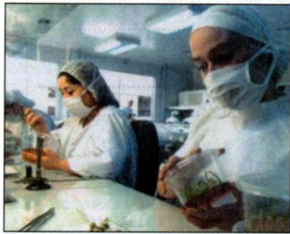
Trabajo asalariado. Analistas de un laboratorio agrícola