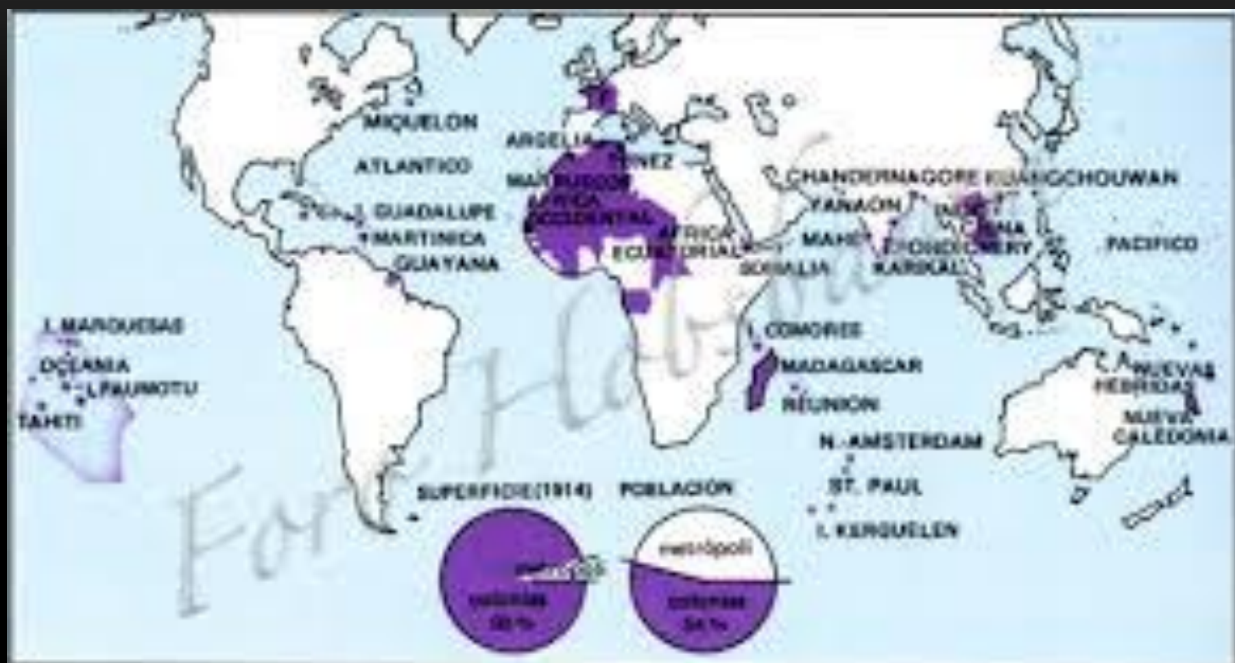
El Imperio colonial francés ha. 1914